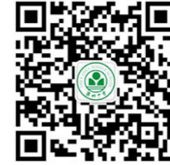
深圳中学官方微信公众号

友情链接： 教育部 广东省教育厅 深圳市教育局 深圳市教育科学研究院 深圳市教师教育网 深圳市中小学教师继续教育网